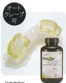
オート クレープ 可 一般医療機器 医療機器届出番号: 23B1X10001A58044 一般的名称: 歯科インプラント補綴用器具 販売名: TrinDy DT-SG-160a サージカル