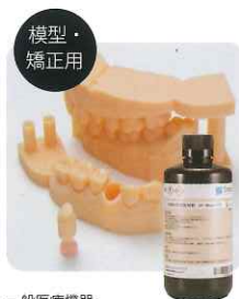
模型・ 矯正用 一般医療機器 医療機器届出番号: 39B2X10004000054 一般的名称: 歯科用樹脂系模型材 販売名: 光硬化性樹脂材料 SP-Model-EY