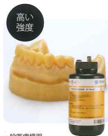
高い 強度 一般医療機器 医療機器届出番号: 39B3X10002000030 一般的名称: 歯科用樹脂系模型材 販売名: 光硬化性樹脂材料 SP-Model