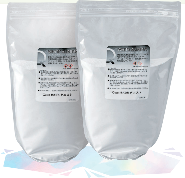
医療機器外製品(雑品)

標準価格 3kg/袋 3,600円 (税抜) 標準価格 20kg/箱 22,500円 (税抜)