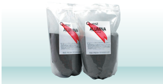
医療機器外製品(雑品)