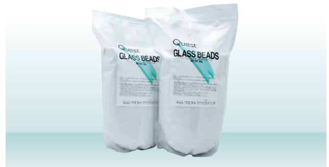
医療機器外製品(雑品)

球体粒子で汚れにくく、切削能力が均一でムラが 少なく、アルミナ処理後の表面加工に適しています