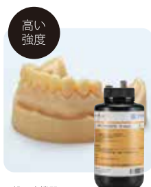
高い 強度 一般医療機器 医療機器届出番号: 39B3X10002000030 一般的名称: 歯科用樹脂系模型材 販売名: 光硬化性樹脂材料 SP-Model