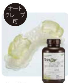
オート クレープ 可 一般医療機器 医療機器届出番号: 23B1X10001A58044 一般的名称: 歯科インプラント補綴用器具 販売名: TrinDy DT-SG-160a サージカル