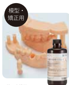
模型・ 矯正用 一般医療機器 医療機器届出番号: 39B2X10004000054 一般的名称: 歯科用樹脂系模型材 販売名: 光硬化性樹脂材料 SP-Model-EY