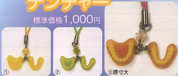
① ② ③原寸大