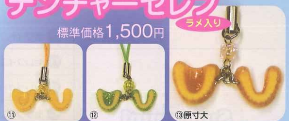
⑪ ⑫ ⑬原寸大