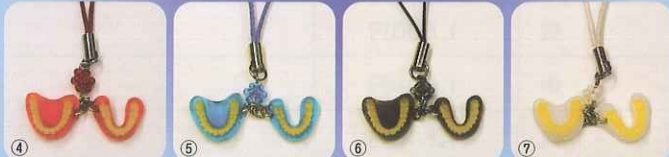
④イエロー ⑤グリーン ⑥ピンク ⑦レッド ⑧ブルー ⑨ブラック ⑩ホワイト