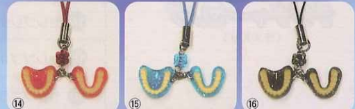
⑭セレブイエロー ⑮セレブグリーン ⑯セレブピンク ⑰セレブレッド ⑱セレブブルー ⑲セレブブラック