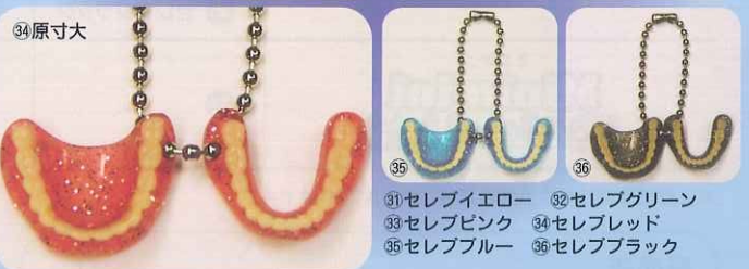
㉗セレブイエロー ㉘セレブグリーン ㉙セレブピンク ㉚セレブレッド ㉛セレブブルー ㉜セレブブラック

※上記標準価格には消費税額等は含まれておりません。 ※掲載商品は品質改良や諸事情により予告なく仕様・外観の変更または製造及び取り扱いを中止させて いただく場合がございます。予めご了承ください。