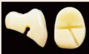
維持孔 (溝) 断面